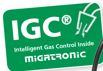
IGC® es una función opcional en Flex 3000

Calcule sus ahorros finales en www.intelligentgascontrol.com .