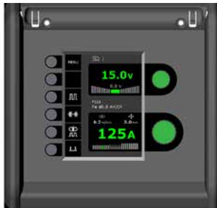
Panel de control de Flex 3000