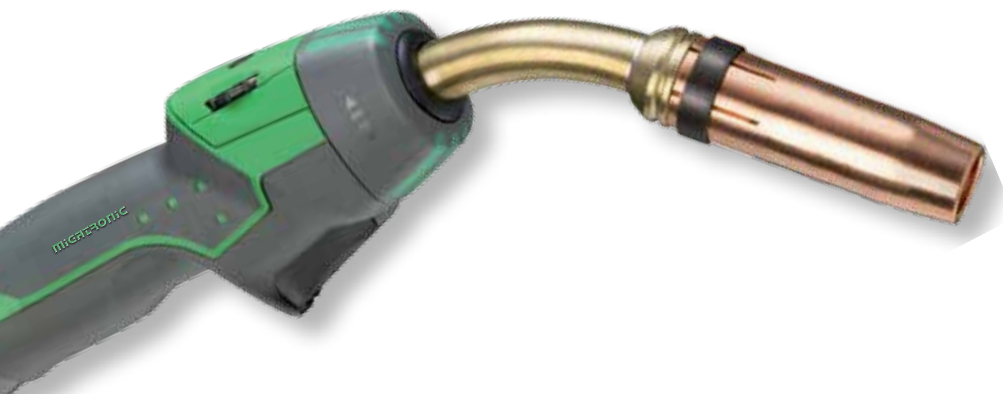
Antorchas ergonómicas para facilitar el acceso

Flex 3000 incluye la antorcha de soldadura MIG-A Twist con un diseño de refrigeración por agua o por aire que ya ha sido premiado. Su exclusivo cuello de cisne girable permite acceder a lugares difíciles. Además, se pueden montar distintos módulos sobre la antorcha para ajustar los parámetros de soldadura más importantes.