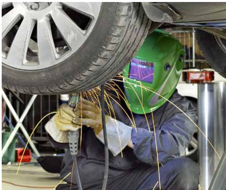
MJCT™ permite guardar hasta 200 trabajos individuales de soldadura

Intelligent Gas Control, IGC®, es una función opcional de Flex 3000; un control de gas dinámico que realiza un seguimiento del consumo y optimiza la protección del gas. IGC® ahorra hasta un 50% en gas, con un cambio inferior proporcional de las bombonas de gas, lo cual supone ventajas en materia de ahorro, medioambiente y eficiencia, sobre todo en el sector del automóvil que se caracteriza por su gran número de soldaduras pequeñas y por puntos.