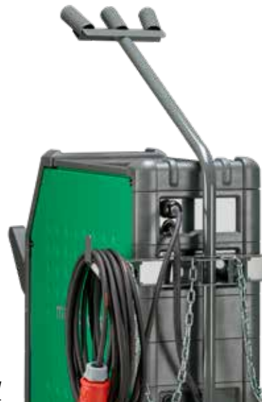
Dispositivo para la fácil recogida de cables largos

Soporte de soplete instalado como equipo estándar, según se ilustra.+ Disponible de forma opcional para instalar en el lado izquierdo de la máquina de soldadura (número de artículo 78861557)