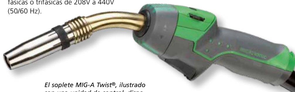
El soplete MIG-A Twist®, ilustrado con una unidad de control, disponible de forma opcional.

MIG-A Twist® está disponible en distintas longitudes y con distintos cuellos de cisne. Se puede configurar con unidades de control diferentes para el ajuste de la corriente de soldadura en el mango del soplete. La unidad de control es fácil de intercambiar según sea necesario, sin tener que usar herramientas.